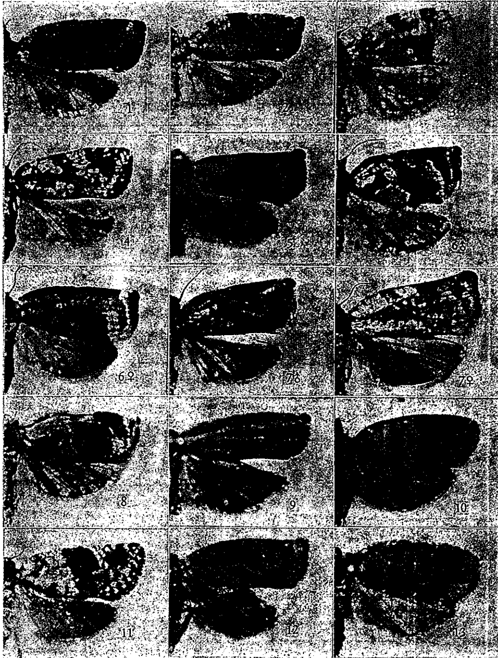
检索表中部分特征图